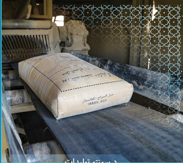
د سمنټو تولیدات

ملي پراختيا شرکت د تولید په برخه کې د ډبرو هڅوله لارې مهمې لاسته راوړنې لري لکه، په یوه ورځ کې د غوري سمنټو فابریکو له ۴۰۰ څخه تر ۵۰۰ ټنو پورې د سمنټو تولید، په یوه ورځ کې د جبل السراج د سمنټو فابریکې له ۲۰ څخه تر ۸۰ ټنو پورې د سمنټو تولید، د مخکې جوړو ودانیزو توکو فابریکه، د آکسیجن د تولید او د مرمر ډبرو پروسس یې د یادولو وړ دي.