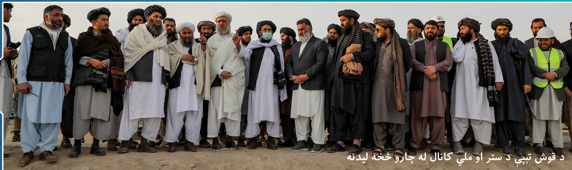
د قوش ټپې د ستر او ملي کانال له چارو څخه ليدنه