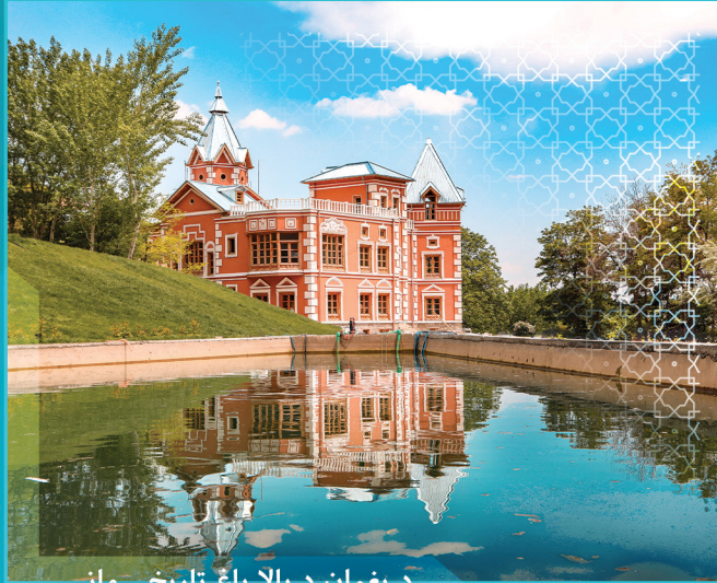
د پغمان د بالا باغ تاریخي ماڼی