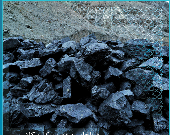
د بلخاب د ډبرو سکارو کان

ملي پراختيا شرکت د هېواد په ځان بسیاینې او د کانونو معیاري استخراج ته ژمن دی، نو ځکه د افغانستان اسلامي امارت کابینې د بلخاب د ډبرو سکارو کاني حوزه د ملي پراختيا شرکت ته ولېږدوله، ترڅو له ترلاسه کېدونکو عوایدو څخه یې د هېواد سترې او ملي پروژې پلي شي.