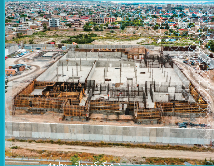
د صکوکو دولتي مطبوعه

ملی پراختیا شرکت د هېواد د تاریخي آبداتو د بیارغونې لپاره ټینګ عزم او اراده لري، ترڅو یې په خپله پخوانۍ بڼه ورغوي او په دې برخه کې یې د هېواد په سطحه بېلا بېلې پروژې تر لاس لاندې نیولي دي، چې ډېری یې بشپړې شوې دي لکه، د دارالامان تاریخي ماڼۍ، هرات تاریخي ګودامونه، جبل السراج ماڼۍ، پغمان د بالا باغ تاریخي ماڼۍ، جلال آباد شاهي ماڼۍ او د پل خشتي جامع جومات بنسټیزه بیارغونه او جوړول.