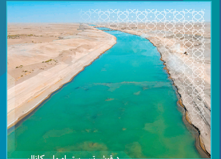
د قوش تېپې ستر او ملی کانال

ملی پراختیا شرکت د هېواد د اوبو مدیریت له خپلو لومړیتوبونو څخه ګڼي او په دې برخه کې یې په لسګونو پروژې تر لاس لاندې نیولي دي، چې د هېواد په شمال کې د قوش تېپې ستر او ملی کانال، د نیمروز ولایت د کمال خان بند د ترکو او قلعه افضل کانالونه، د فراه ولایت کانال، په پکتیا ولایت کې د مچلغو بند، په زابل ولایت کې د تورې بند او په بېلا بېلو ولایتونو کې د ۴۲ بندونو طرح او ډیزاین یې د یادولو وړ دي.